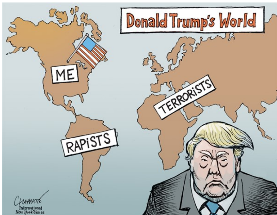
Le Monde de Donald Trump Moi, Voleurs, Terroristes. Dessin Chapatte

Petrolea Brasileiro SA, l'entreprise pétrolière nationale, n'arrive plus à trouver du cash pour refinancer ses dettes. La note est passée à Ba3 et les fonds de pensions internationaux ne peuvent pas investir dans des actions pourries.